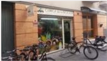
Alquiler de bicicletas Bike rental