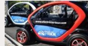
Tour coches eléctricos Electric car tour